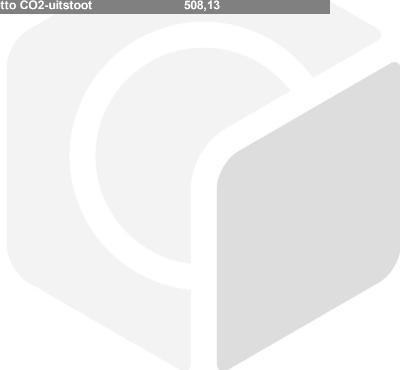
Tabel 4 footprint 2022